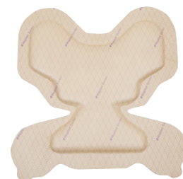
Mepilex Border Heel