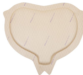
Mepilex Border Sacrum

Appliser den heftende siden mot såret. Ikke strekk.