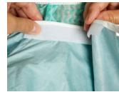
5. Fest med krok og lomme.