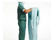
2. Før begge hender og underarmene inn i armåpningene og ermene, og hold hendene i skulderhøyde og vekk fra kroppen.