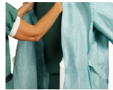
4. Ambulerende sykepleier må dra frakken over skuldrene og bare berøre innsiden av frakken.