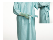
9. Finn igjen ytterreimen ved å dra den ut av reimkortet som ambulerende sykepleier holder, og knytt den sammen med den andre ytterreimen på venstre side.

Les mer på www.molnlycke.no Molnlycke Health Care AS, 1305 Oslo, Norge. Molnlycke Health Care, 1305 Oslo, Norge. Molnlycke Health Care, 1305 Oslo, Norge. Molnlycke Health Care AS, 1305 Oslo, Norge. Molnlycke Health Care, 1305 Oslo, Norge. Molnlycke Health Care, 1305 Oslo, Norge. © 2020 Molnlycke Health Care AS. Alle rettigheter reservert.