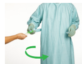
8. Rekk reimkortet til ambulerende sykepleier, og snu deg deretter en tre fjerdedels runde til venstre mens ambulerende sykepleier trekker ytterreimen helt ut.