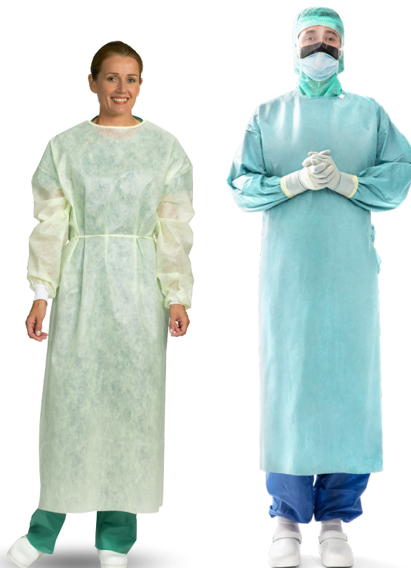
Usteril langermet beskyttelsesfrakk

I denne artikkelen skal vi se nærmere på anbefalingene for hvordan vi tar av og på oss langermet usteril beskyttelsesfrakk, steril operasjonsfrakk, usterile undersøkeshansker og sterile operasjonshansker, samt hvor viktig det er med håndhygiene.