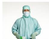
7. Når du er ferdig påkledd, griper du reimkortet med begge hender, skiller den venstre ytterreimen fra reimkortet og holder reimen i venstre hånd.