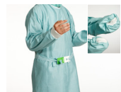
3a. Når du bruker teknikk med åpen hanske, drar du mansjetten til tommelnivå.