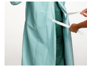
6. Knytt den innvendige reimen på frakken.