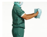
1. Før begge hendene inn i armåpningene. Hold frakken vekk fra kroppen, og la den folde seg helt ut.

Grip den sterile frakken, og gå inn i et område der du kan åpne frakken uten kontamineringsrisiko.